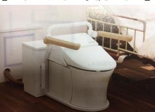
【ベッドサイド水洗トイレ】

ベッドのそばで水洗トイレが可能。床に固定しないので、使う人の状況に合わせて移動できる