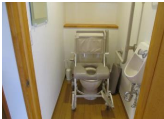
【水まわり用車いす】